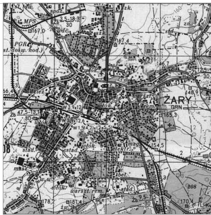
Szkic orientacyjny w skali 1:50000

województwo lubuskie, powiat zarski, jedn. ewid. 081102_1, miasto Zary, obręb 081102_1.0007, działki nr 208, 211/1, 377/27, wg. zakresu