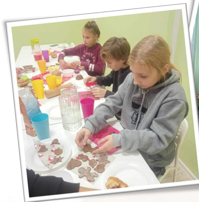
☀ Fundacja Pomocy Dzieciom „SI-GMA” ul. Pułaskiego 7b, 68-200 Żary