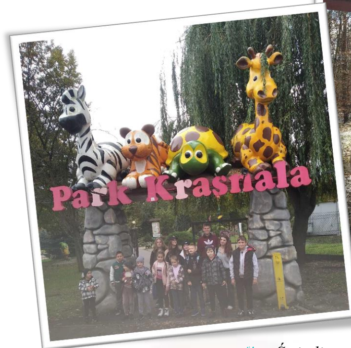
✿ Świetlica parafialna „Bajka” przy Parafii pw. NSPJ w Żarach