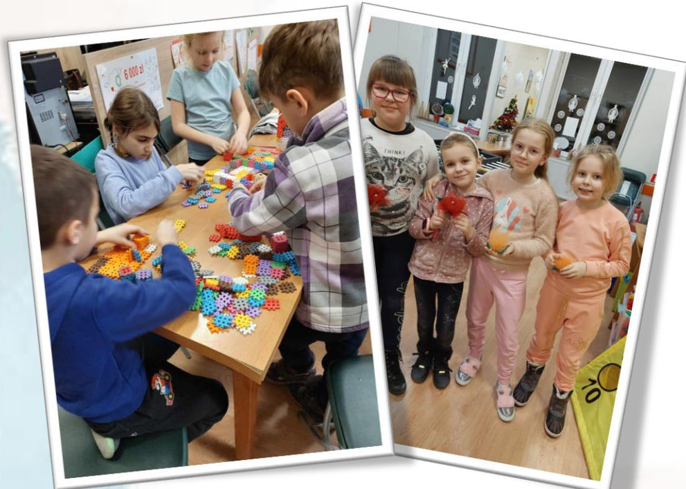
☀ Towarzystwo Przyjaciół Dzieci Świetlica „PROMYK” ul. Podchorążych 4a, 68-200 Żary

W roku 2023 na terenie naszego miasta funkcjonowały cztery świetlice środowiskowe, w których zabezpieczono 103 miejsca. Dzieci otrzymały pomoc w nauce. Miały okazję do wspólnej zabawy oraz integracji. Brały udział w zorganizowanych zajęciach rozwijających własne zainteresowania. Łącznie na ten cel przeznaczono 148 921,00 zł.