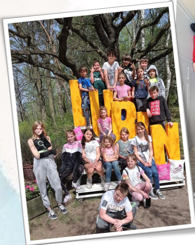
✿ Świetlica środowiskowa „Piątka” ul. Okrzei 35, 68-200 Żary