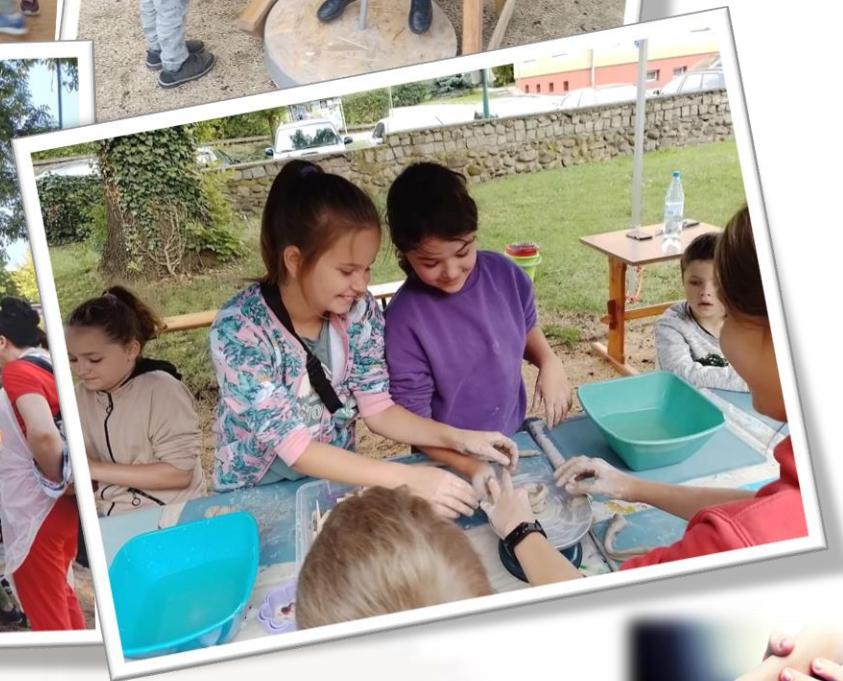
☀ Fotorelacja z wakacji zorganizowanych przez Muzeum Pogranicza Śląsko - Łużyckiego w Żarach