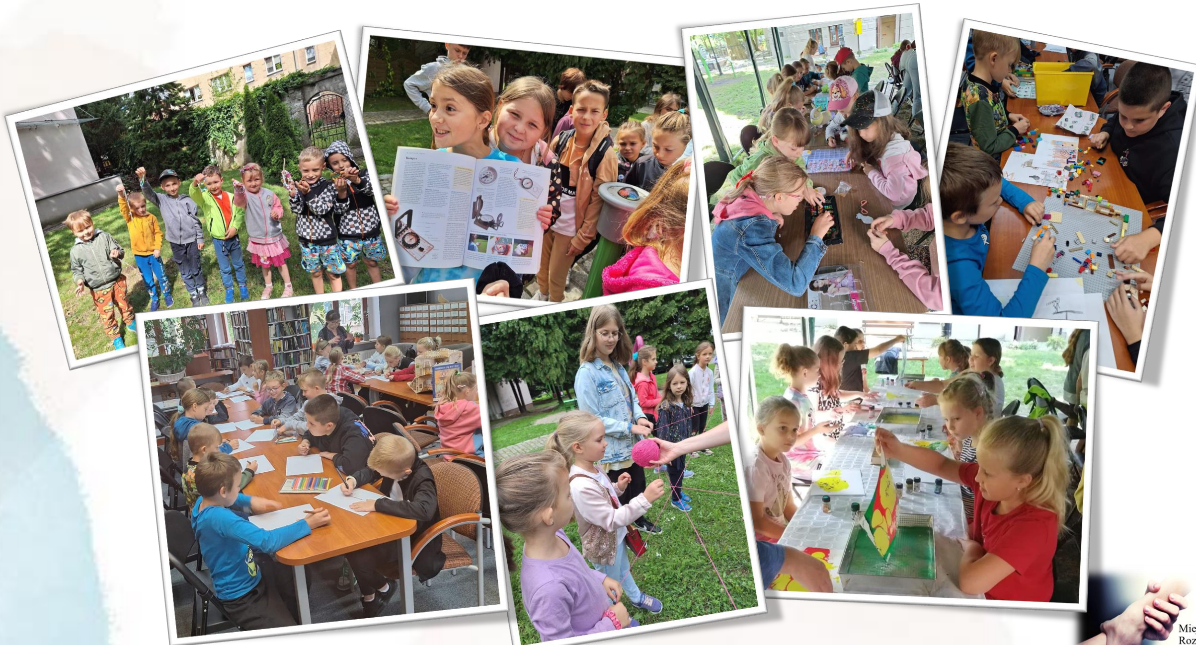
Fotorelacja z wakacji zorganizowanych przez Miejską Bibliotekę Publiczną w Żarach