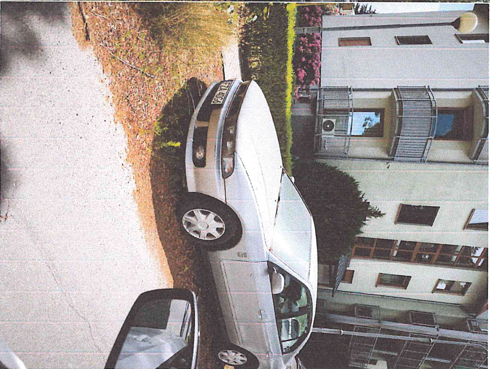
Mitsubishi z ulicy Spokojnej.

A handwritten signature in blue ink, located in the bottom right corner of the page. The signature is stylized and appears to be a name.