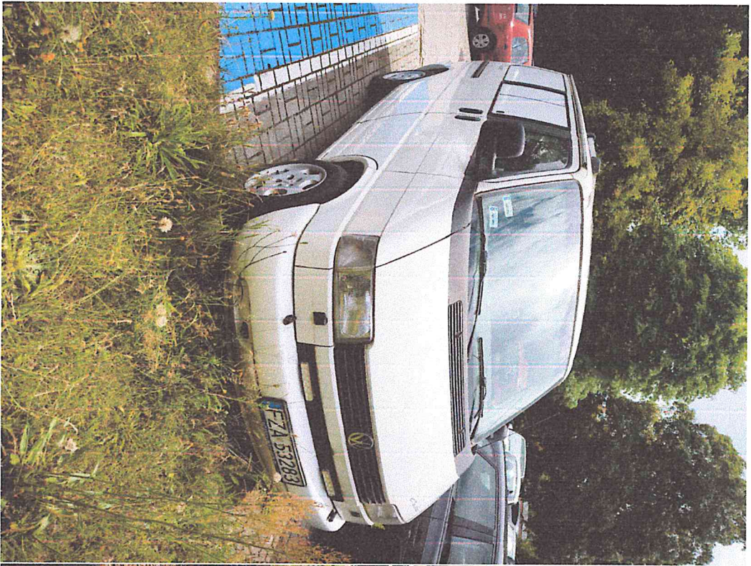
Parking za blokami z ulicy Emilii Plater.