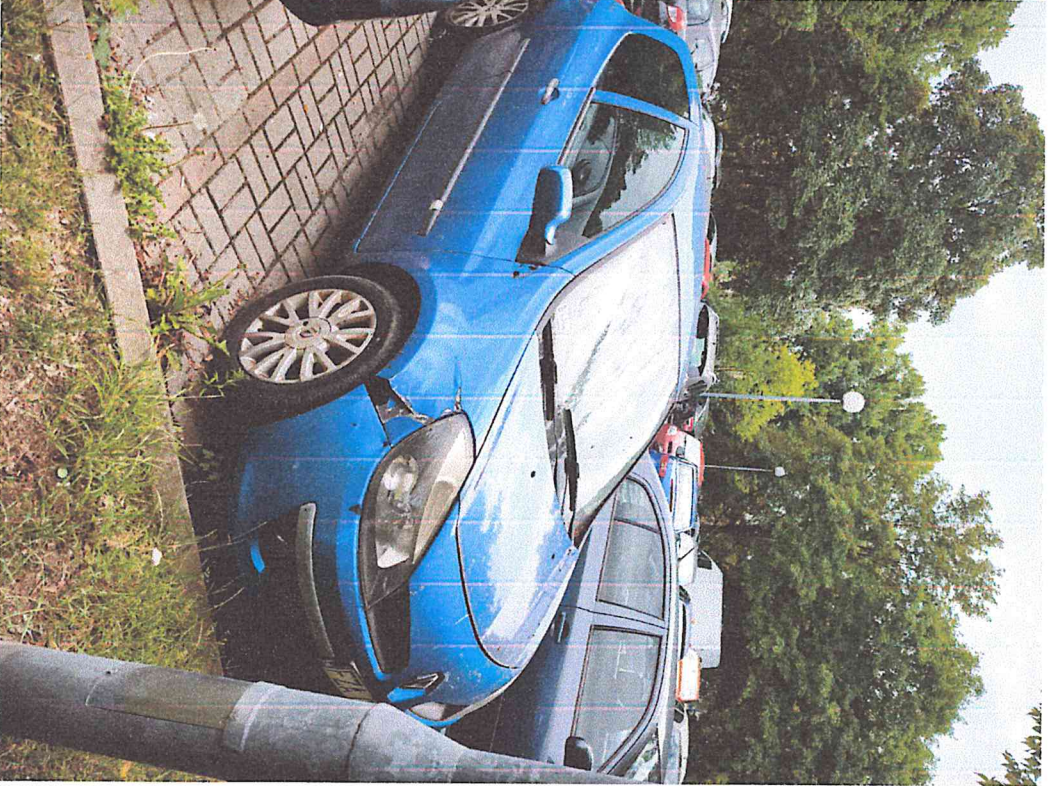
Parking za blokami z ulicy Emiliji Plater

A handwritten signature in blue ink, located in the bottom right corner of the page. The signature is stylized and appears to be a name.