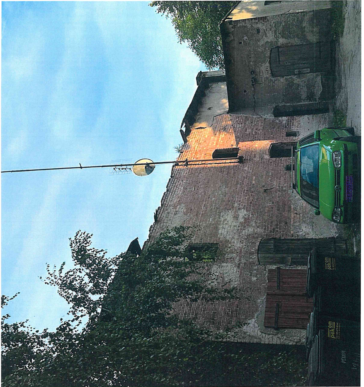
W. Sa. Broche Aldeste 1 e Zored