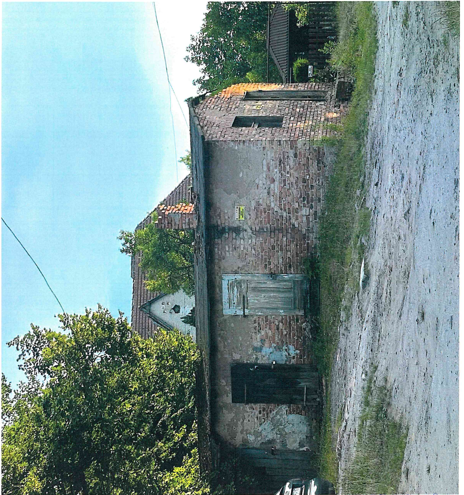
ul. Milose 15 u Zarech